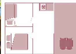
Antigüedad del alojamiento: 3 años