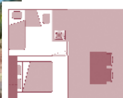
Antigüedad del alojamiento: 3 años